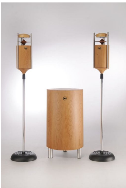
Naturschallwandler SUNRAY Kirsch

Die Mundus Naturschallwandler bringen eine harmonische, entspannte Atmosphäre, was sich positiv auf das Klima auswirkt, wo immer Menschen zusammen leben und arbeiten.